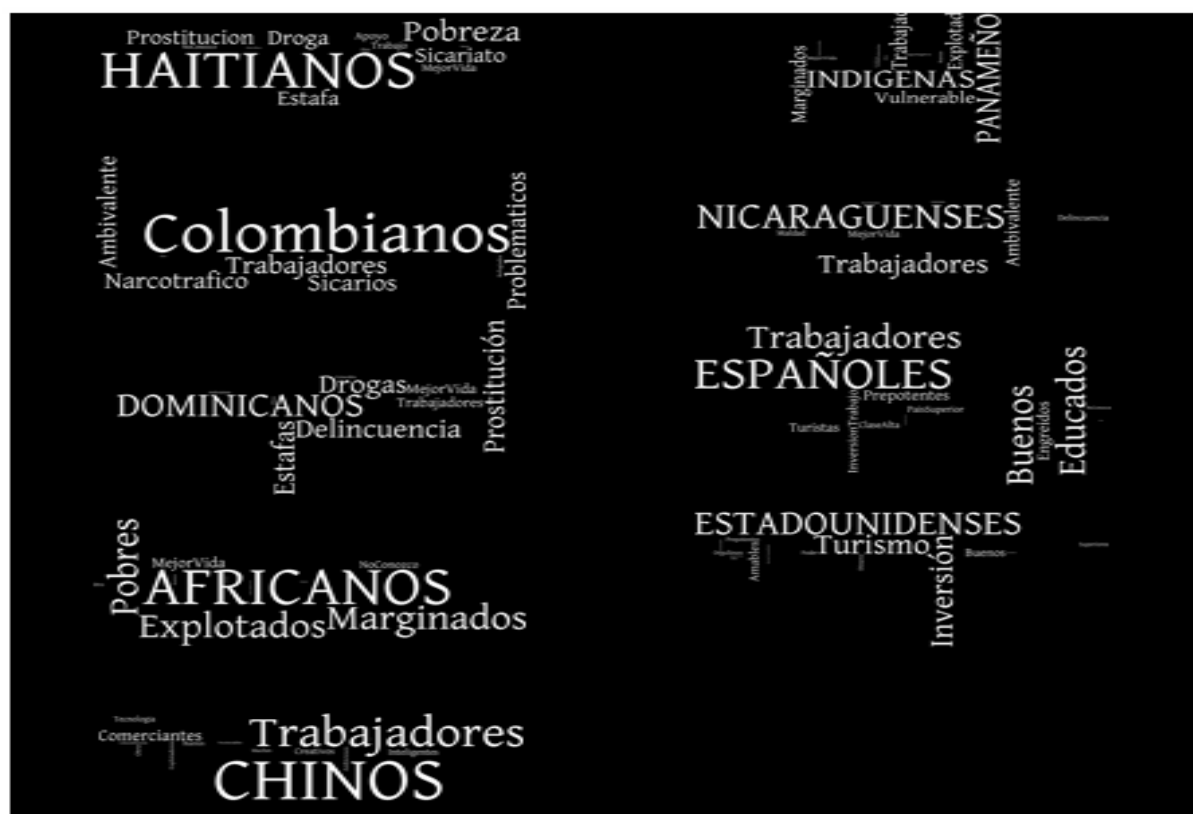
Figura 1. Nubes de palabras asociadas a las caracterizaciones de población migrante en Costa Rica. 2012.