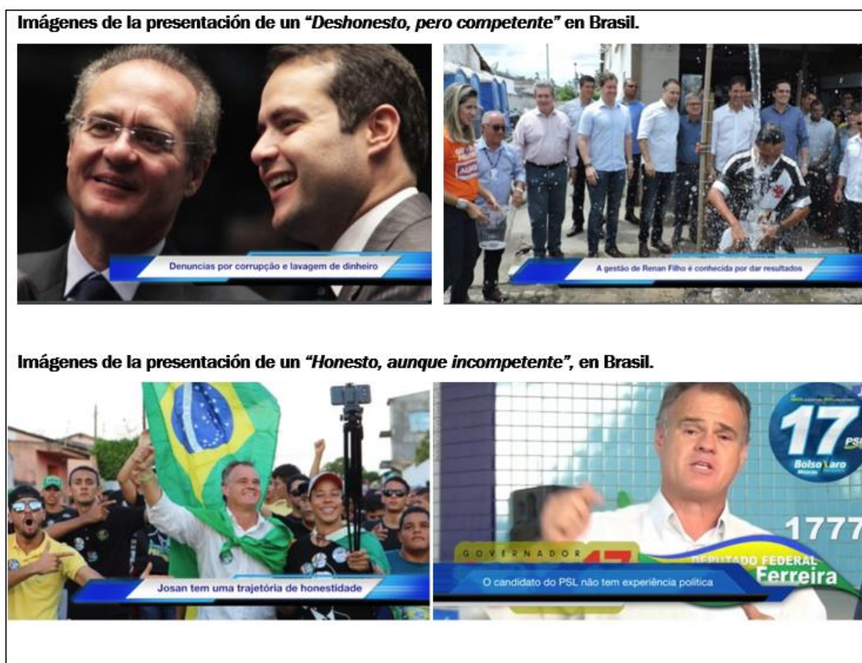
Cuadro 3. Imágenes de viñetas en formato de video que presentan el dilema entre “Deshonestos, pero competentes” y “Honestos, aunque incompetentes”

Para medir los aspectos afectivos, se presentaron viñetas audiovisuales en formato noticioso con información sobre candidatos reales de las elecciones de 2018. Una viñeta mostraba a un candidato como “deshonesto pero competente” y otra como “honesto pero incompetente”, con imágenes y narraciones de periodistas profesionales. En algunas viñetas, se indicaba que los datos eran de “información oficial” y en otras, de “fuentes no oficiales”, con el fin de probar la hipótesis de Winters y Weitz-Shapiro (2013), quienes argumentan que en Brasil, cuando un votante está seguro de la corrupción de un político, basado en información verificada, es intolerante con la corrupción y penaliza con su voto (Cuadro 3).